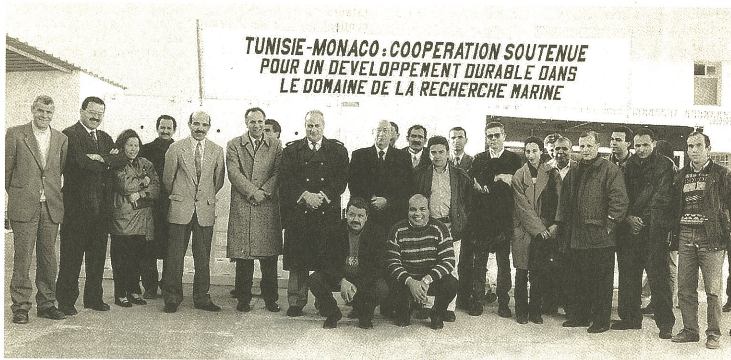
La remise officielle des grottes à corail, il y a quelques semaines, à l'Institut national des sciences et technologies de la mer à Salambo en Tunisie en présence notamment du consul général de Monaco à Tunis.

L'expérience de culture du corail, menée pendant dix ans en Principauté, se poursuit en Tunisie grâce à l'aide du gouvernement et de l'Association monégasque pour la protection de la nature