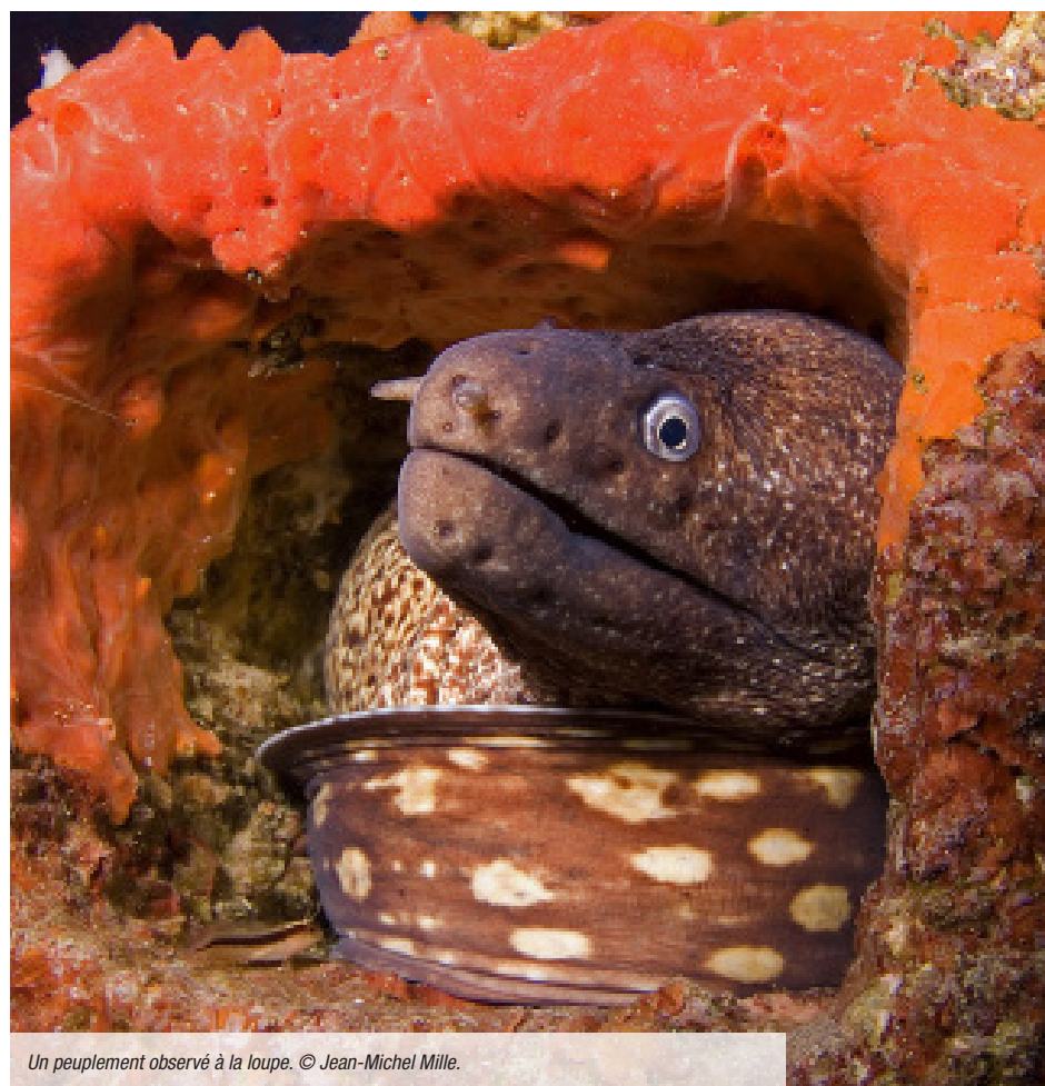
Un peuplement observé à la loupe.

« Comparativement à nos collègues de l'équipe de physiologie et biochimie corallienne, qui travaillent au niveau moléculaire et cellulaire, notre équipe travaille plus au niveau de la colonie de corail et du récif, et se déplace plus souvent sur le terrain » me confie-t-elle, devant les incroyables aquariums hébergés par le CSM, riches de plusieurs dizaines d'espèces de